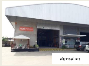
สมุทรสาคร