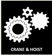
CRANE & HOIST